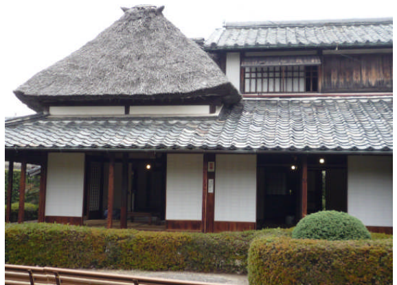
【佐賀市・大隈重信の生家】

そのため、千之助は帰国後、藩校「弘道館」の蘭学寮頭取をしていた大隈重信(1838～1922)に英学の必要性を熱く語った。千之助の主張を受け入れた大隈は、1867年に長崎五島町にオランダ系アメリカ人の宣教師ガイド・フルベッキ(1830～98)を教師に迎えて英学塾「蕃学稽古所」(翌年「致遠館」と改称。現在の佐賀県立致遠館中学・高校の前身)を設立し、後に大隈は「自分の世界観は千之助に負うところが多かった」と述懐している。