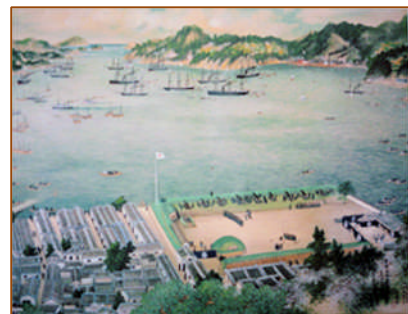
【佐賀藩邸(長崎大黒町)砲台図