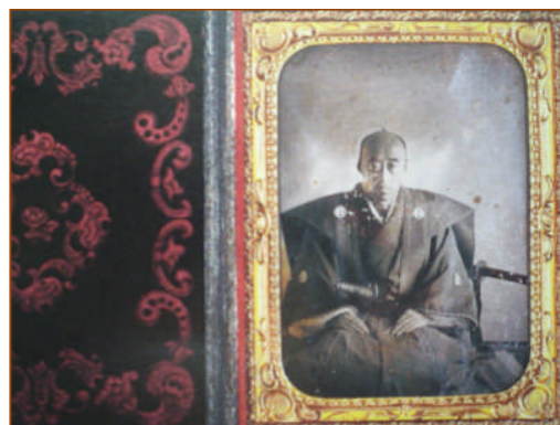
【道眠が撮った藩主斉正 鍋島報効会絵葉書より】

とある日、一行はワシントン・ハイツのジェームズ・ゴードン・ベネットの別荘に招待された。ベネット氏は、今から 25 年ほど前 (1835 年) に『ニューヨーク・ヘラルド』紙を創刊して成功した人物だという。ベネット氏は 60 代半ばぐらいの人物で、息子は 20 歳になったばかりのような青年であった。使節団は、主人らに正式な歓迎を受けた。庭園では数百名