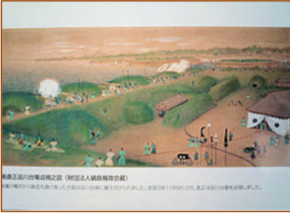
【鍋島斉正、品川台場巡視 之図鍋島報効会絵葉書より】

1850年に佐賀藩は日本で最初の反射炉建設に成功させた。それゆえに53年には幕府から品川砲台の備砲の注文があった。続く56年には伊豆韮山の砲術家江川のもとに技術交流のため、佐賀藩は田代孫三郎と杉谷雍助を派遣するほどであった。