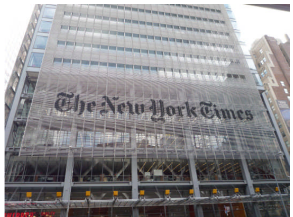
【ニューヨーク市・ The New York Times 社】

味噌・醤油の臭いから逃げるアメリカ人、バターや肉の臭いに閉口する日本人、血が滴り落ちるような肉を旨いというアメリカ人、新鮮な魚を食べたがる日本人、“対極”的なそ