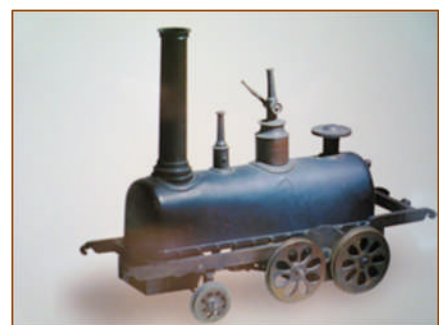
【蒸気車雛形(日本最古)

無論、一行は汽車に乗るのは初めてであった。雷鳴のような音を轟かせながら汽車は走る。とくに佐賀藩の連中は興奮していた。藩では精錬方が汽車と蒸気船の雛型を造っていたが、こうして現実に線路の上を突っ走ることができようとは夢にも思わなかったからで