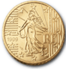
【EUROコイン「種をまく人」】