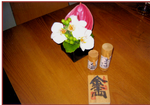
【黒文字、黒七味、粉山椒】

各テーブルには、日本橋『さるや』の黒文字、京都祇園『原了郭』の黒七味や粉山椒が置かれ、私はすっかり『円』に和んでしまいました。