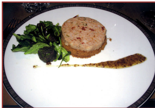
【 Farine du Sarrasin 】