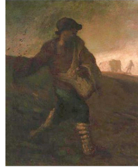
【ミレー「種をまく人」絵ハガキより】