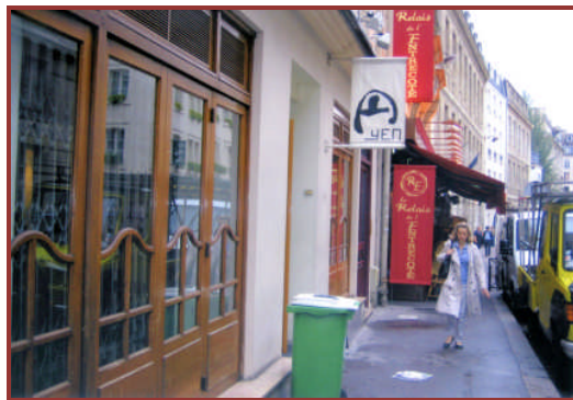
【サン・ジェルマン・デ・プレにある『円』】

『円』はパリ6区サン・ジェルマン・デ・プレにあり、パリ最古の教会の一つサン・ジェルマン・デ・プレ教会、有名なカフェ『レ・ドゥ・マゴ』、『カフェ・ドゥ・フロール』もすぐ近くです。ここの空気を吸ってるだけで、もうパリのマダムになってしまいます。