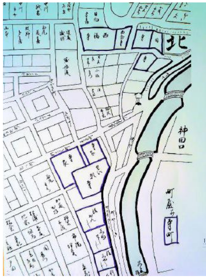
【寛永九年の神田界限】