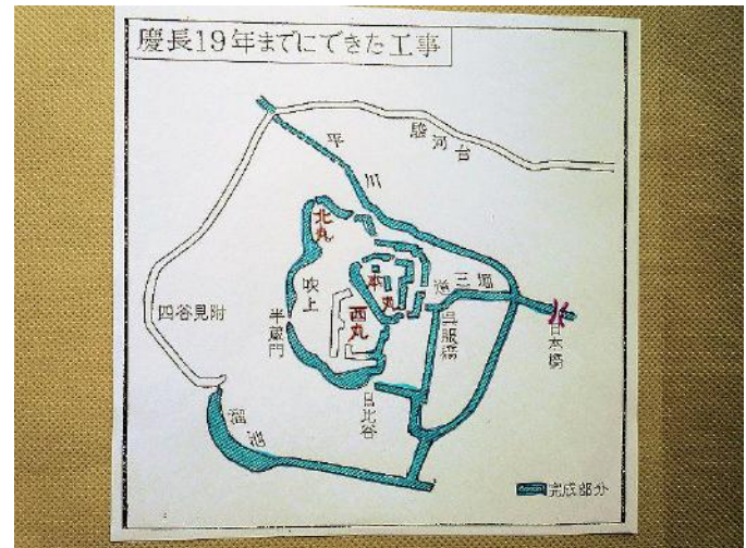
【慶長十九年の江戸城】

「怪僧」と呼ばれた天台宗無量寿寺(河越)の天また上野国厩橋藩主・酒井忠世(上屋敷:大手外