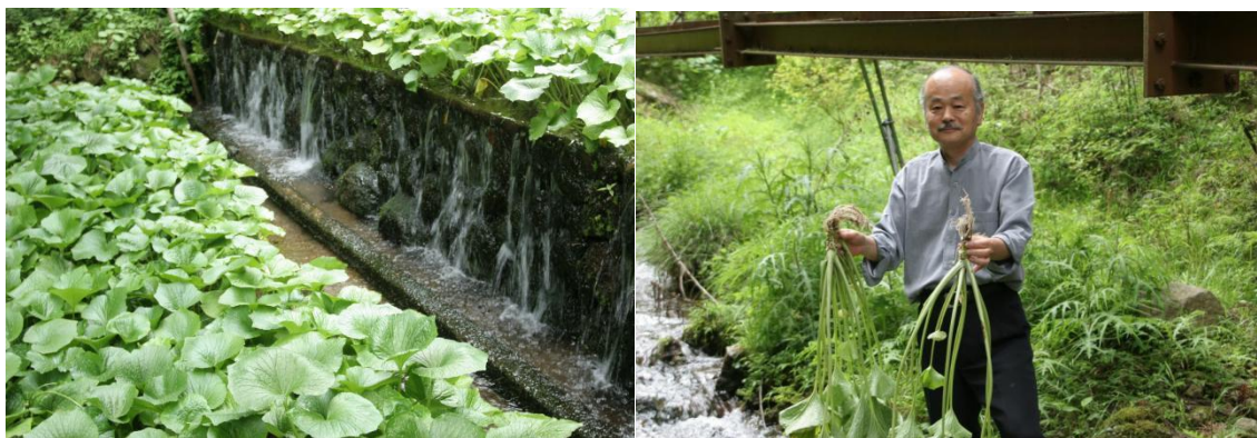
〔伊豆城ヶ島 山葵田〕